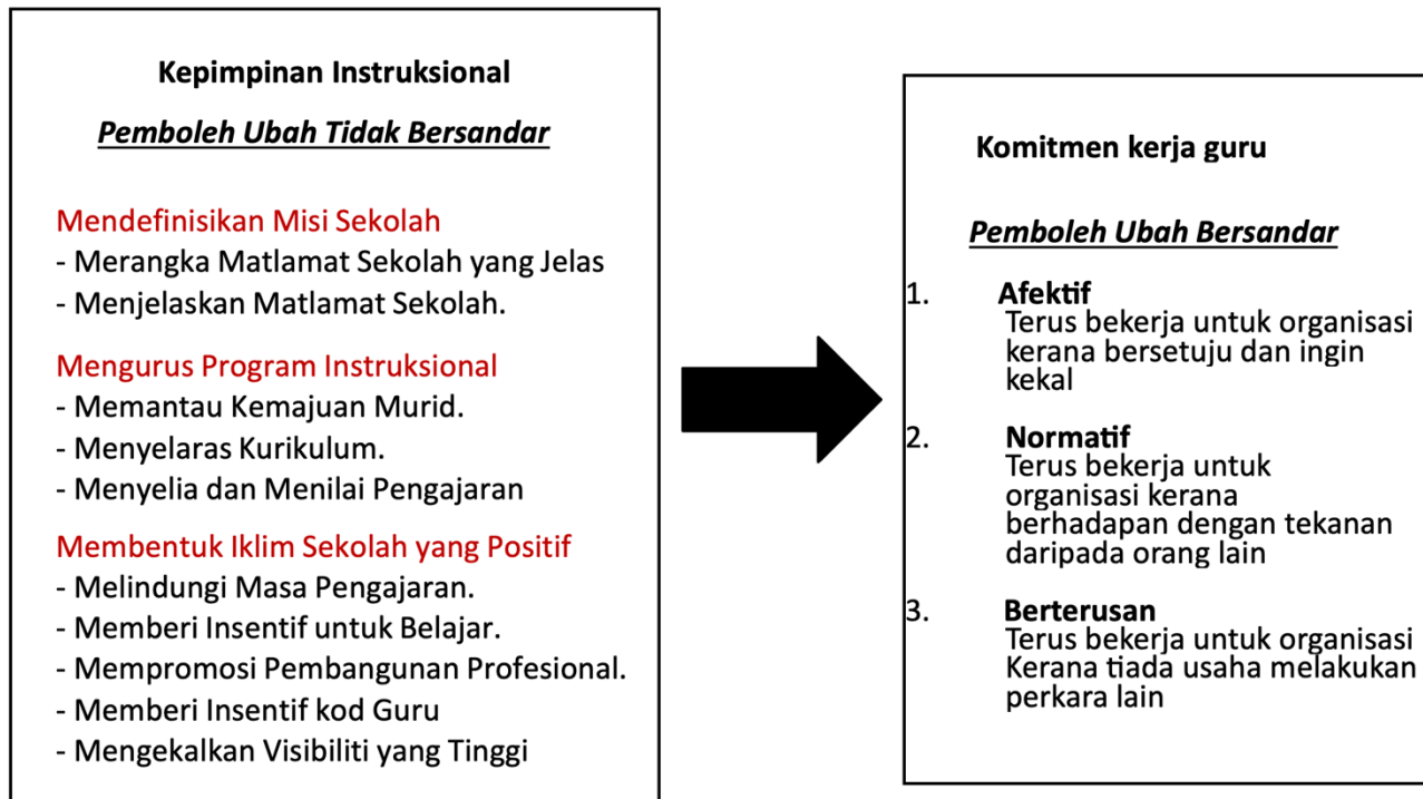
Rajah 3: Kerangka Koseptual Kajian