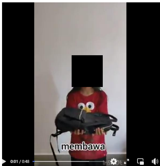
Gambar 2. PK B melakukan aksi kata kerja “membawa”