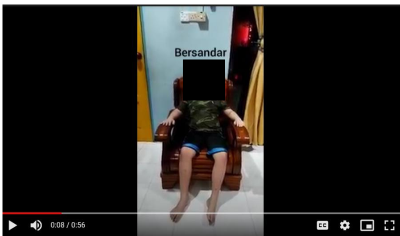
Gambar 3. PK C melakukan aksi kata kerja “bersandar”