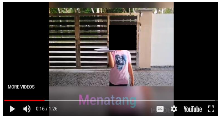
Gambar 1. PK A melakukan aksi kata kerja “menatang”