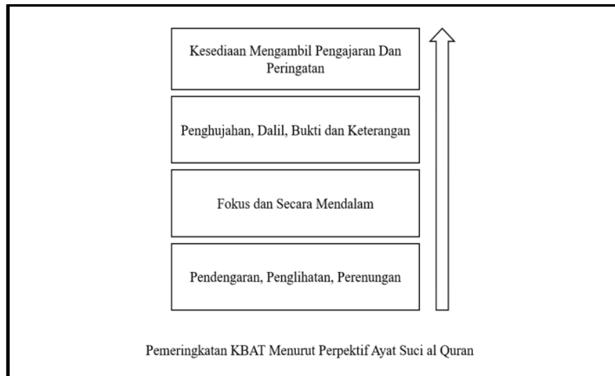
Rajah 2: Aras Pemikiran Aras Tinggi Menurut Perspektif al-Quran

Peringkat pertama elemen KBAT yang melibatkan sintesis aktiviti pendengaran, pemerhatian dan merenung. Kalimah-kalimah yang dimaksudkan ialah kalimah ( nazar ), ( ra'a ) dan ( basar ). Gabungan aktiviti-aktiviti ini berupaya untuk merangsang minda individu untuk berfikir aras tinggi. Ini terbukti melalui penggunaan kata-kata tersebut yang kerap diulang dalam al-Quran (Zainorah, 2015). Justeru, sesiapa sahaja mampu untuk berfikir aras tinggi selama ia mempunyai pendengaran, penglihatan dan hati. Seterusnya, peringkat ke dua elemen kritis iaitu proses bagaimana idea yang terhasil pada peringkat pertama diaplikasikan secara kritikal, bermatlamat, pendetailan, berfokus dan mendalam yang berlaku dalam minda individu. Proses ini perlu dilakukan secara sedar, bersungguh-sungguh serta berfokus. Dalam al-Quran kalimah-kalimah yang relevan dengan peringkat ini antaranya seperti kalimah ( wa'yu ), ( qalbun ) dan ( fuad ).