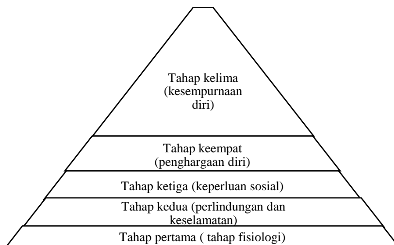
Rajah 3: Teori Maslow (teori piramid keperluan manusia)

Situasi dalam petikan tersebut juga boleh dikaitkan dengan Teori Maslow yang sememangnya sangat berkait rapat dengan kehidupan manusia dan ia selalu digunakan dalam bidang psikologi untuk mengenalpasti tahap keperluan manusia. Menurut Jaffary Awang et al. (2017) dalam artikel berjudul Teori Maslow Dan Kaitannya Dengan Kehidupan Muslim, Teori Maslow mempunyai pengaruh yang besar dalam berbagai-bagai aspek kehidupan manusia seperti aspek falsafah, psikologi, agama dan pendidikan. Teori ini menjelaskan terdapat lima tahap berdasarkan teori keperluan manusia yang perlu dipenuhi oleh seseorang untuk memperoleh kesempurnaan hidup.